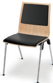
Modell 4012: Buche natur, Sitz- und Rückenpolster