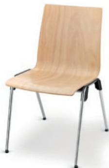
Modell 4010: Buche natur, ungepolstert