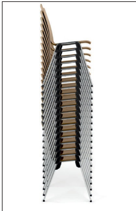
Modell 4010 Stapel