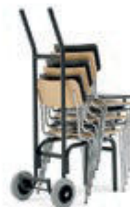
Modell 1036: Stuhlkarre