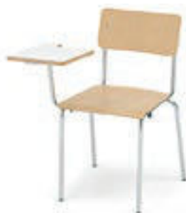
Modell 1010: mit Schreibtisch