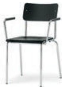
Modell 1010/A: Buche gebeizt, Armlehnen mit Soft-Grip-Schlauch