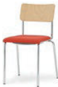
Modell 1011: Buche natur, mit Sitzpolster