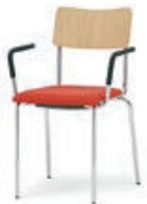
Modell 1011/A: Buche natur, mit Sitzpolster, Armlehnen mit Soft-Grip-Schlauch