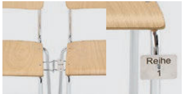
Detail: Schieberegienverbindung und Sitznummerierung