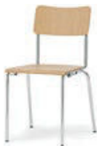
Modell 1010: Buche natur