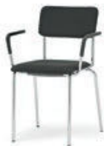
Modell 1012/A: mit Sitz- und Rückenpolster, Armlehnen mit Soft-Grip-Schlauch