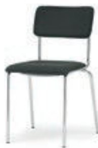
Modell 1012: mit Sitz- und Rückenpolster