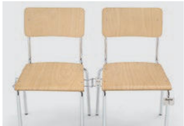
Modell 1010: Buche natur mit Schiebereihenverbindung, Sitz- und Reihennummerierung