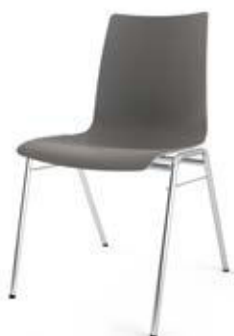
Modell 1520: Kunststoff, ungepolstert