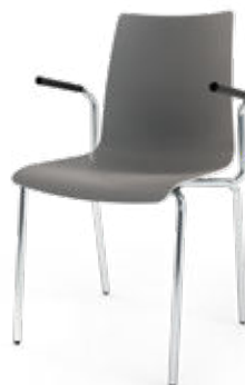
Modell 1510/A: Kunststoff, ungepolstert