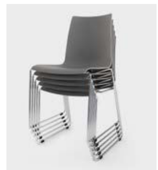
Modell 1530: Stapel