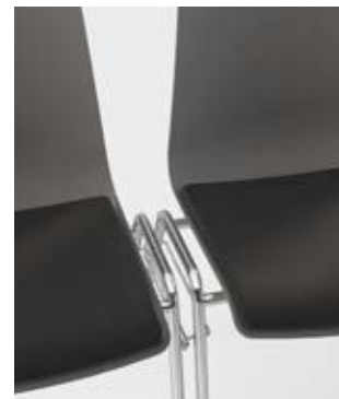
Modell 1521: mit Einak-Reihenverbindung