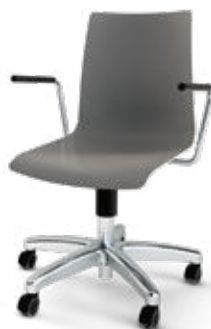
Modell 1550/A: Kunststoff, ungepolstert, Gestell mit Aluminium Fußkreuzgestell