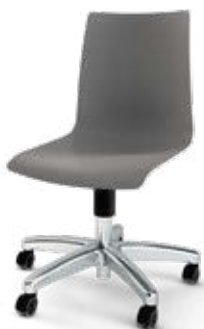
Modell 1550: Kunststoff, ungepolstert, Gestell mit Aluminium Fußkreuzgestell