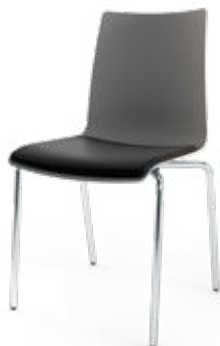
Modell 1511: Kunststoff, Sitzpolster