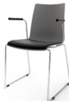
Modell 1531/A: Kunststoff, Sitzpolster