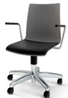
Modell 1551/A: Kunststoff, Sitzpolster, Gestell mit Aluminium Fußkreuzgestell