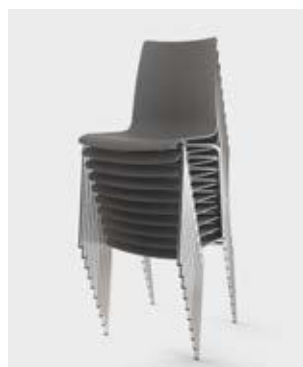
Modell 1520: Stapel