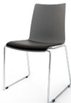
Modell 1531: Kunststoff, Sitzpolster