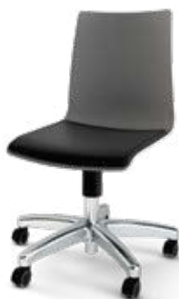
Modell 1551: Kunststoff, Sitzpolster, Gestell mit Aluminium Fußkreuzgestell