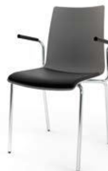
Modell 1511/A: Kunststoff, Sitzpolster