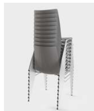
Modell 1520: Stapel