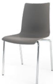
Modell 1510: Kunststoff, ungepolstert