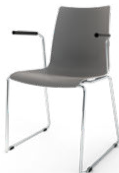
Modell 1530/A: Kunststoff, ungepolstert